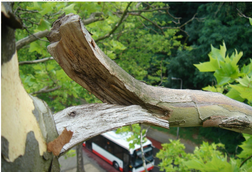
Foto 1. Massaria

Massaria wordt veroorzaakt door de schimmel Splanchnonema platani en wordt vooral aangetroffen in platanen ouder dan dertig jaar. Uitzonderingen gelden voor knot- en leivormen. De schimmel tast zowel dunne twijgen als dikke gesteltakken aan en zorgt voor een snel optredende houtrot met de kans op takbreuk tot gevolg. Een aangepaste controle is dus nodig. Een moeilijke bijkomstigheid daarbij is dat de aantasting zich vooral aan de bovenzijde van de takken openbaart. Daardoor is een normale visuele controle vanaf de grond niet mogelijk.