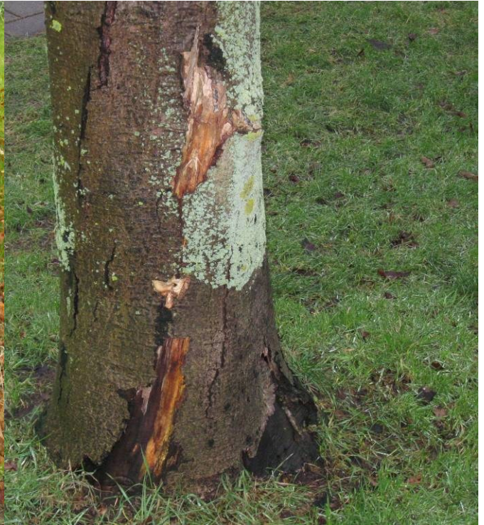
Afsterven bastweefsel bij PKBZ