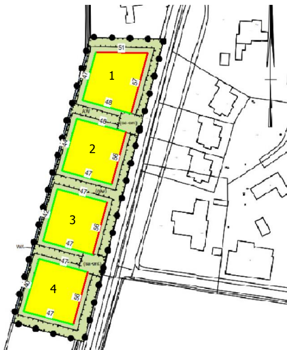
Figuur 2. Cumulatieve geluidsbelasting per bouwvlakzijde (groen is geluidsluw, rood is niet geluidsluw).