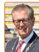
Zeewolde, G. Gorter