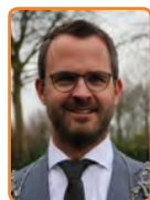
Lopik, L. de Graaf