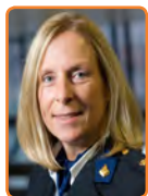
Politie Midden- Nederland, G. van Leeuwen