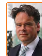
Openbaar Ministerie, R. Jeuken