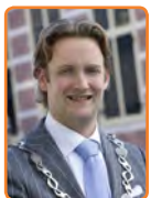
Oudewater, P. Verhoeve