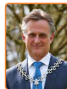
Soest, R. Metz