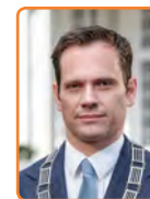
De Bilt, S. Potters