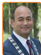
Wijdmeren, F. Ossel