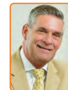
Utrechtse Heuvelrug, G. Naafs