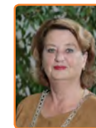
Laren, R. Kruisinga