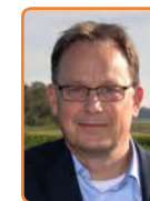
Noordoostpolder, H. Bouman