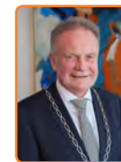
Huizen, S. Helldoorn