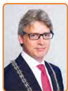
Amersfoort, L. Bolsius