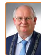
Nieuwegein, F. Backhuijs