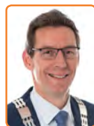
Wijk bij Duurstede, T. Poppens