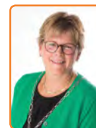
Woudenberg, T. Cnossen