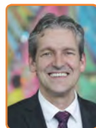
Rhenen, J. van der Pas