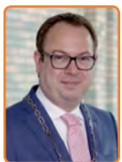
Eemnes, R. van Benthem