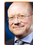
De Ronde Venen, M. Divendal