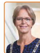
Stichtse Vecht, Y. van Mastrigt