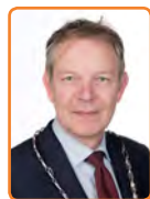
Baarn, M. Röell