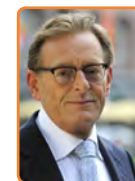
Zeist, K. Janssen