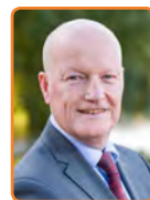
Bunnik, R. van Bennekom