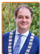
Leusden, G. Bouwmeester