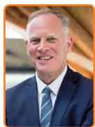
Gooise Meren, H. ter Heegde