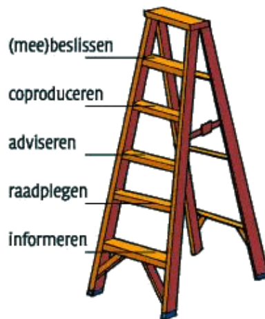
Figuur 3 Participatieladder

De participatieladder is een denkinstrument om bij verschillende ontwikkelings- en procesfasen na te gaan welk participatieniveau het beste ingezet kan worden [zie deel III, bijlage V 'Participatiemodel'].