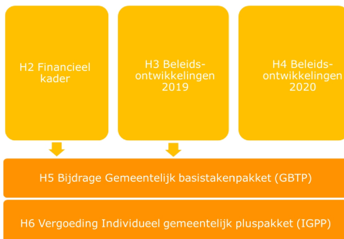
Figuur 2: opbouw kadernota